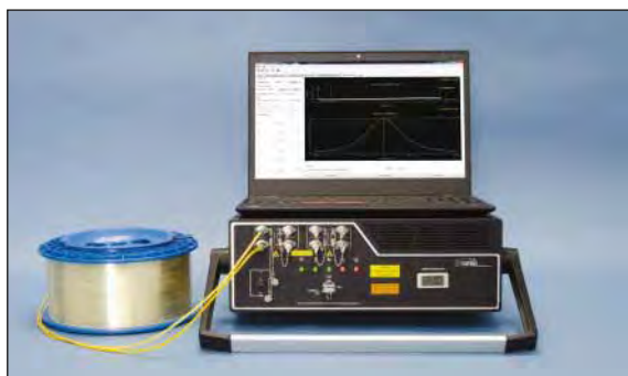
3U модель с Ноутбук компьютером

Версия 3U этих DSTS оснащена съемной ручкой, которая может быть заменена пользователем с помощью вкладок, которые позволяют устройству быть установленным в стандартной 19-дюймовой стойке. Монитор, клавиатура и мышь не включены.