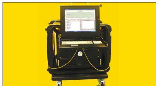
Модель для полевого использования

Версия 3U этих DSTS оснащена съемной ручкой, которая может быть заменена пользователем с помощью вкладок, которые позволяют устройству быть установленным в стандартной 19-дюймовой стойке. Монитор, клавиатура и мышь не включены.