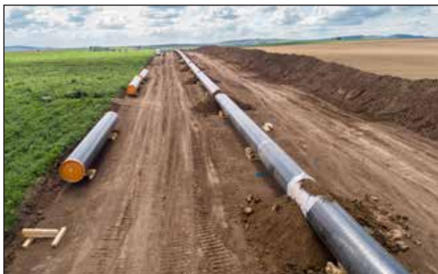
油气管线泄漏监测