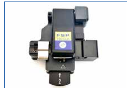
精密光纤切刀 - FSP-100-CLV