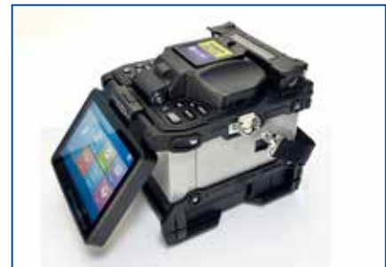
光纤熔接机 - FSP-100-S/M