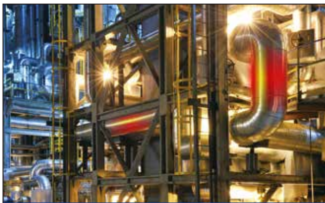
反应塔生产效率监测