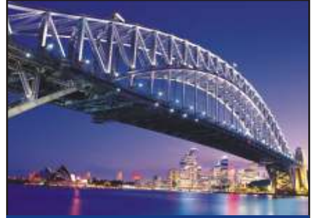
Köprü ve Bina Kontrolü

Enerji Hatları Kontrolü için olan teknik yazımıza bakınız