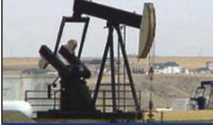
Petrol ve Gaz Kuyusu Kontrolü

Boru hattı korozyonu tesbiti için olan teknik yazımıza bakınız