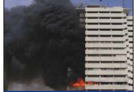
Bina Yangın Tesbiti