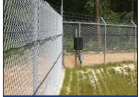
Sınır Güvenlik Kontrolü

Kırık Tesbiti için olan teknik yazımıza bakınız