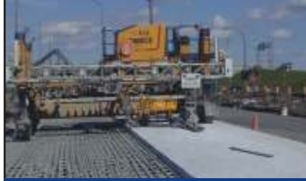
Otoyol Güvenlik Kontrolü

Kırık Tesbiti için olan teknik yazımıza bakınız