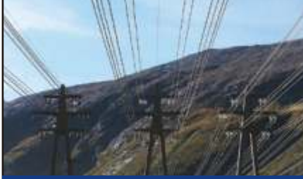
Enerji Hattı Kontrolü

Enerji Hatları Kontrolü için olan teknik yazımıza bakınız