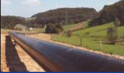
Petrol ve Gaz Boru Hattı Kontrolü

Boru hattı bükülmesi tesbiti için olan teknik yazımıza bakınız