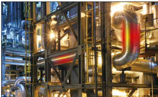
反应塔生产效率监测