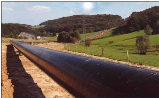
油气管线泄漏监测