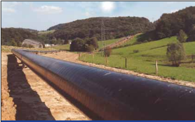
油气管线泄漏监测